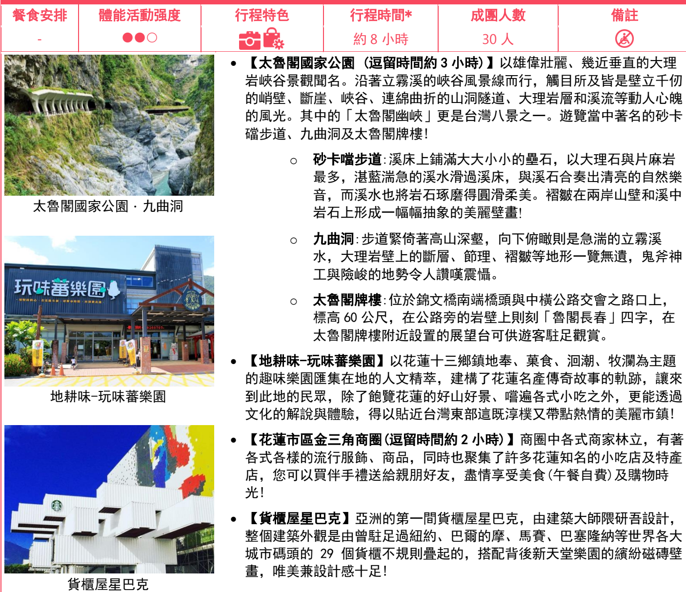
太魯閣國家公園・九曲洞