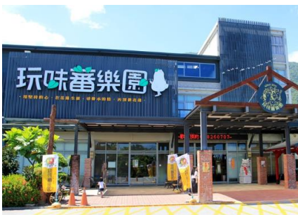
地耕味-玩味蕃樂園